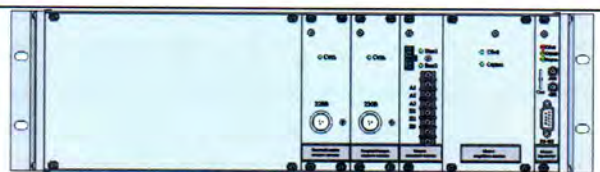
Рисунок 10 - Электронный блок резервированного блока питания повышенной надежности (вид сзади)