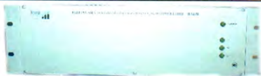
Рисунок 7 - Электронный блок ЦАП Н для вывода пропорционального аналогового сигнала 100/\sqrt{3} В ДНЕЭ