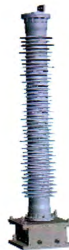
Рисунок 5 - Высоковольтный емкостной делитель с встроенным в изолятор компенсатором температурного расширения ДНЕЭ-123-М