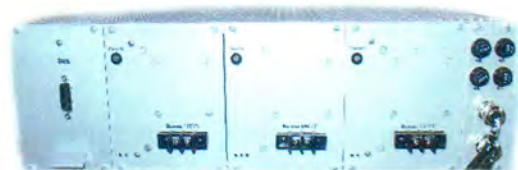
Рисунок 8 - Электронный блок ЦАП Н для вывода пропорционального аналогового сигнала 100/\sqrt{3} В ДНЕЭ вид сзади